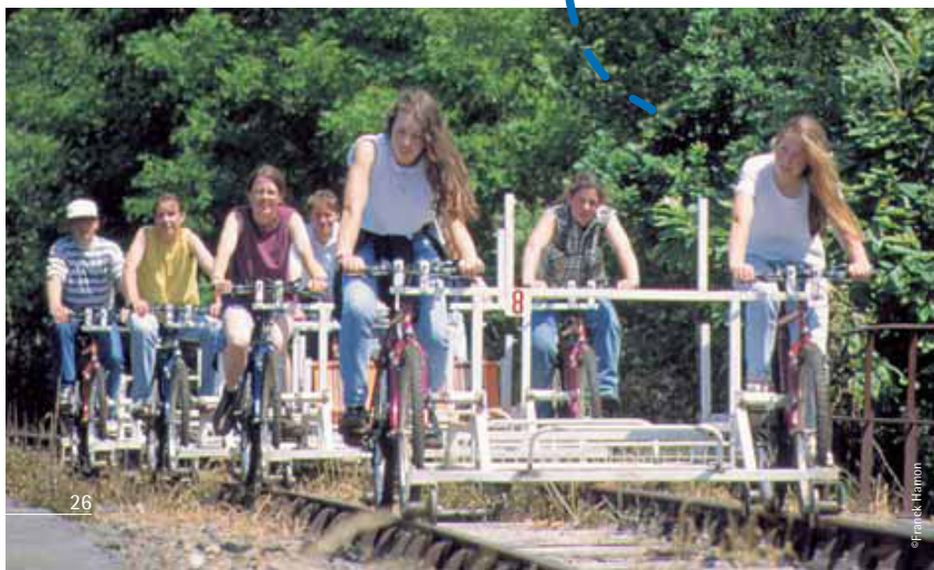
Le vélo-rail à Médréac.