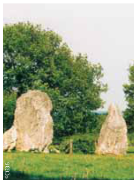
Les mégalithes de Lampouy à Médréac.