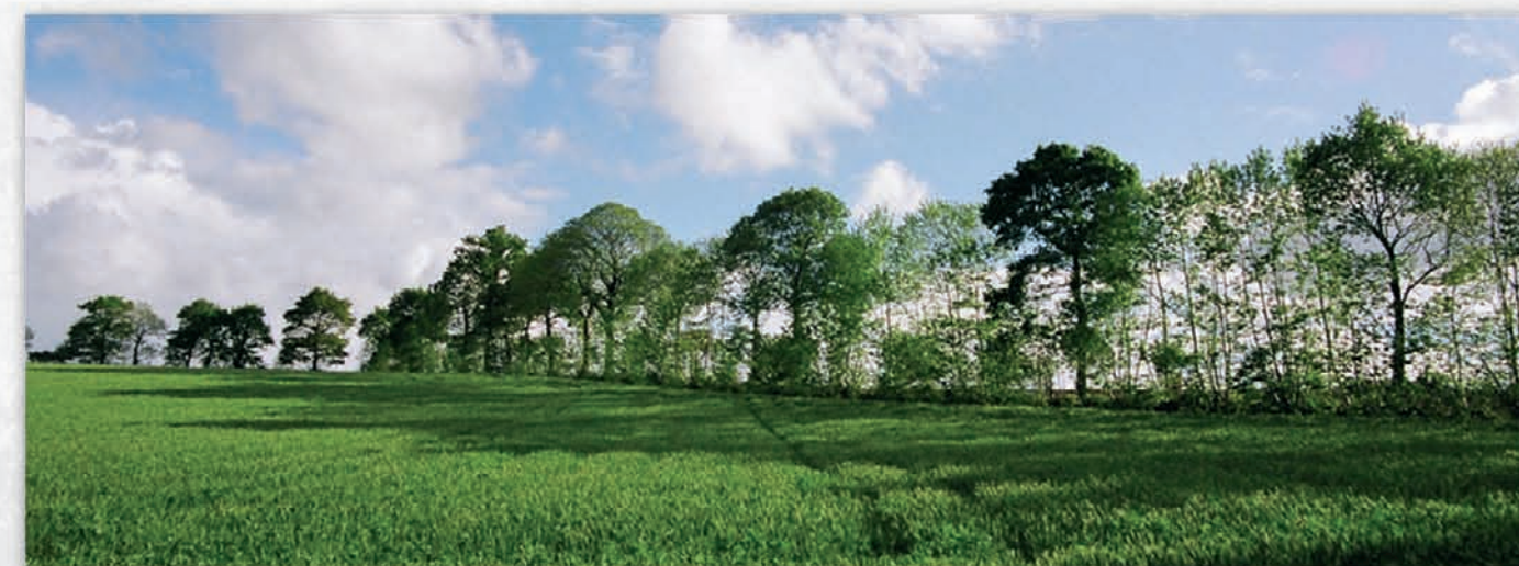
Exemple de linéaire bocager structurant

Son origine et sa construction progressive sont issues du travail de plusieurs générations d'agriculteurs... Son évolution récente est celle d'un vieillissement et d'une dislocation lente du maillage ancien.