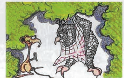
Dessins source CERESA

○ Réguler l'Eau, Conserver les Sols : Les haies et talus en travers des pentes ralentissent ou stoppent le ruissellement, favorisent l'infiltration, limitent l'érosion des sols, prélèvent des nutriments. En bordure de fossés, de prairies humides, ils filtrent les arrivées latérales de substances polluantes dans les cours d'eau.