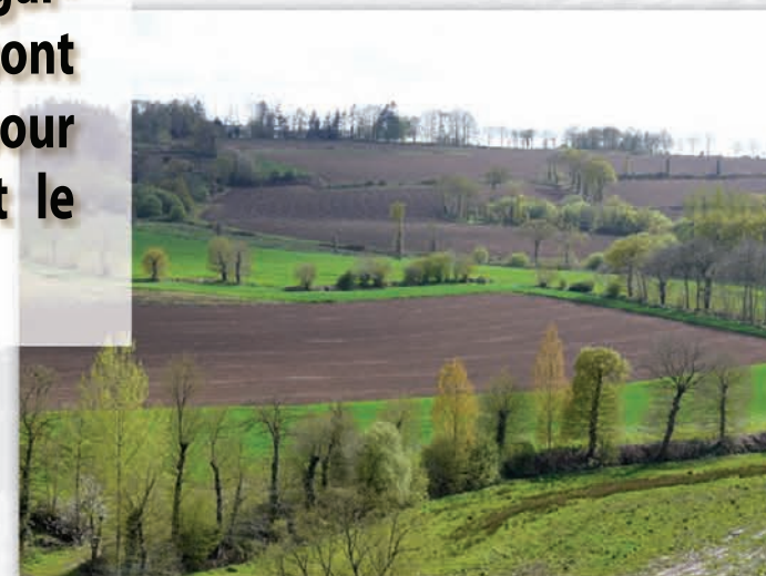
Un bocage en évolution - Miniac-sous-Bécherel

La qualité des haies, et leur organisation en réseau donne la cohérence et la valeur d'avenir à ce paysage.