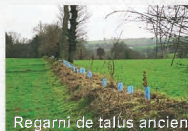
Regarni de talus ancien