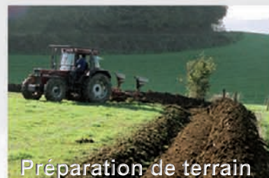
Préparation de terrain