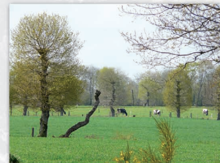
Un bocage vieillissant - Romillé

Pour une action concertée entre agriculteurs et territoire.