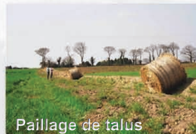
Paillage de talus