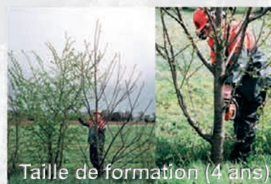
Taille de formation (4 ans)