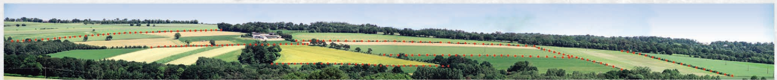
• • • Exemple de résultat des plantations en maillage établies par trois agriculteurs (Association Terres & Bocages - Centre Bretagne).

○ Protéger les Troupeaux : Le long des haies, le bétail peut s'abriter du vent, des intempéries, du trop grand soleil... Elles servent de repères, améliorent le confort des bêtes et permettent de prolonger et mieux valoriser les périodes de pâturage. La protection des vents mouillés d'Ouest et Sud-Ouest est appréciée.